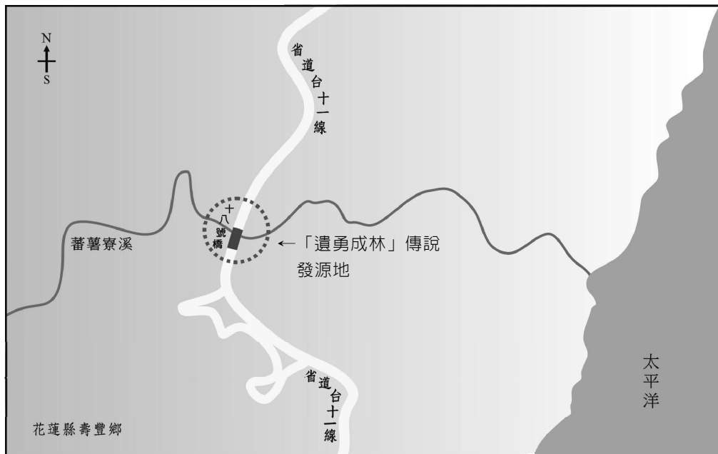
圖 1 花蓮縣壽豐鄉水璉村蕃薯寮「遺勇成林」傳說發源地地理位置圖 (筆者構圖；李柏漢繪製)

相傳早年居住在番薯寮坑附近的阿美族，十分崇尚勇士，因此立下規矩，只要能用竹子撐竿跳過溪谷，大家就尊奉他為酋長。但溪谷頗寬，難以跳越，有許多青年便因跳不過而葬身谷底。他們所用的竹竿，插在溪谷邊，日久長成一片密密的竹林，而有「遺勇成林」之說。 9