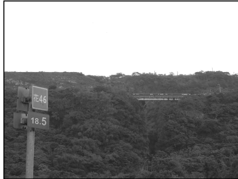
圖 5 仰望省道台十一線十八號橋下方的蕃薯寮峽谷