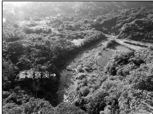
圖 2 花蓮縣壽豐鄉水璉村蕃薯寮溪