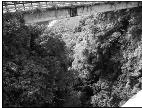
圖 6 花蓮縣壽豐鄉水璉村蕃薯寮「遺勇成林」景觀