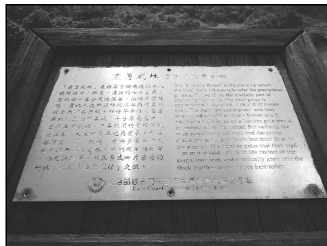
圖 7 交通部觀光局東部海岸國家風景區管理處所立「遺勇成林」解說牌