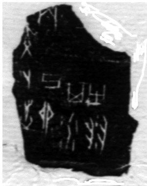
圖 2：《奧岳齋·殷器別鑒·殷契國粹》46 搨本和照片