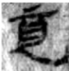
《居延(貳)》203.14 漢元帝年號「鄣卒張竟」